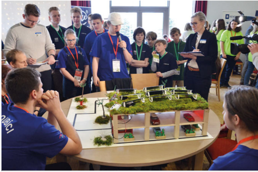
Soutěžící jednoho z týmů při prezentaci projektu před odbornou porotou.

Letošní soutěžní úkol spočíval ve vytvoření chytrého parkovacího domu včetně vytvoření jeho kulis a naprogramování autíčka Maqueen. „Zadání samotné soutěže se třefuje do oborů, kterým se žáci střední průmyslové školy věnují. Už podruhé se povedlo najít studenty, kteří se moderní technice (programování, IoT, robotika, 3D tisk) věnují