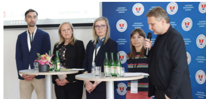
Zástupci jihočeských organizací při zahájení akce Business STAR(t).

Na začátku roku se Jihočeská hospodářská komora stala partnerem přeshraniční startupové soutěže, kterou podporuje Jihočeský kraj a zemská vláda Horního Rakouska. Ti vyhlásili 2. ročník soutěže Cross-Border Idea & Start-up Contest, do které mohli podnikavci posílat