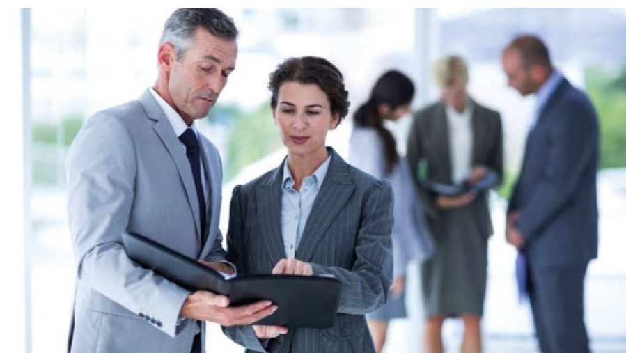
Podnikání v Česku se za posledních 30 let výrazně proměnilo. Mnohé firmy nyní řeší předání vedení mladším nástupcům.

Slova ředitele Jhk potvrzují i data Hospodářské komory ČR (HK ČR), která letos k 30. výročí českého podnikání vydává Komorové analýzy české ekonomiky. Tak třeba reálná produktivita práce v Česku vzrostla od rozdělení Československa o 85 %. Výrazný nárůst je znatelný i v počtu firem a živnostníků. Zatímco v roce 1993 v Česku působilo 1,25 mil. OSVČ, podniků s ručením omezeným, akciových společností a dalších obchodních subjektů, v roce 2021 jich bylo 2,98 mil. V současné době tak v ČR působí přibližně 2,4krát více ekonomických subjektů než před 30 lety. Zároveň roste podíl obchodních společností, z nichž podstatnou část tvoří malé a střední podniky, a význam specializovaných činností s vyšší přidanou hodnotou, uvádí HK ČR.