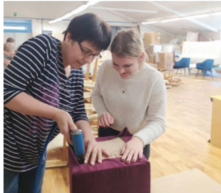
Žáci ze ZŠ Husinec si vyzkoušeli čalounění ve firmě NEUK.

V druhé polovině března Oblastní kancelář Jihočeské hospodářské komory v Prachaticích připravila pro žáky osmých a devátých tříd základních škol z regionu praktické workshopy ve členských firmách Pekařství Cais a čalounické dílně NEUK. Všechny workshopy probíhají v rámci Asistenčního centra Impuls pro kariéru a praxi Jhk, které se svými aktivitami snaží žákům přiblížit profese v jihočeských firmách.