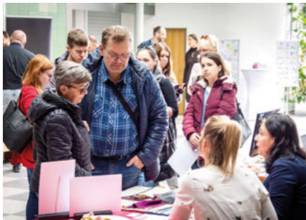
Zájemci o zaměstnání na Veletrhu práce v Jindřichově Hradci.

Veletrhy práce, které letos Jihočeská hospodářská komora uspořádala v 7 městech jižních Čech, byly příležitostí pro firmy získat nejen nové zaměstnance, ale i navázat spolupráci s odbornými školami a jejich žáky z regionu. Díky veletrhům firmy také představily svou nabídku více jak 1 200 účastníkům, kteří si mohli nové zaměstnání najít také on-line na portále www.veletrhy-prace.cz .