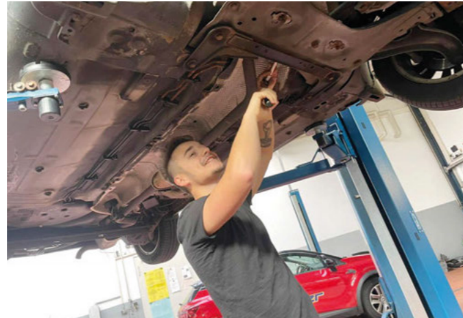
Žáci VOŠ a SPŠ automobilní a technické v Českých Budějovicích na praxi v dílnách.

Žáci velmi ocenili, že je majitelé servisů a vedoucí dílen plnohodnotně zapojili do všech činností a mohli si tak vyzkoušet práci v zahraniční firmě a zapojit se do pracovního kolektivu. Tato mobilita je tak motivovala ke kladnému postoji při učení se cizímu jazyku, ale především je motivovala po stránce odborné, k dalšímu prohlubování svých dosud získaných zkušeností a znalostí na naší škole. Ověřili