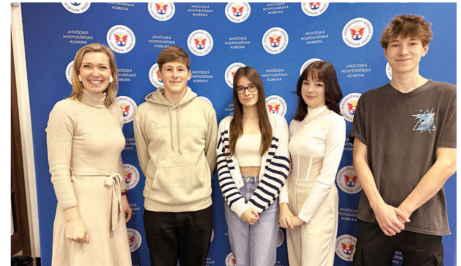
Tým žáků z Obchodní akademie Husova 1 při setkání s Danou Feferlovou na Jhk

„Tato soutěž žáky velmi obohatila po odborné stránce. Došlo k propojení teoretických poznatků s praxí. Žáci se především naučili vytvářet projektovou dokumentaci a poznali, jak fungují evropské dotační programy a čerpání dotací. Největší zkušenosti pak bylo osobní setkání s primátorkou města Českých Budějovic a náměstkem hejtmána pro Jihočeský kraj,“ říká Stanislava Velcová a dodává, že největší motivací bylo vymyslet, jak zlepšit okolí školy za pomoci evropské dotace a celkově uspět v soutěži. Nadšení pro další realizaci bylo i to, že projekt sklidil velké uznání odborníků